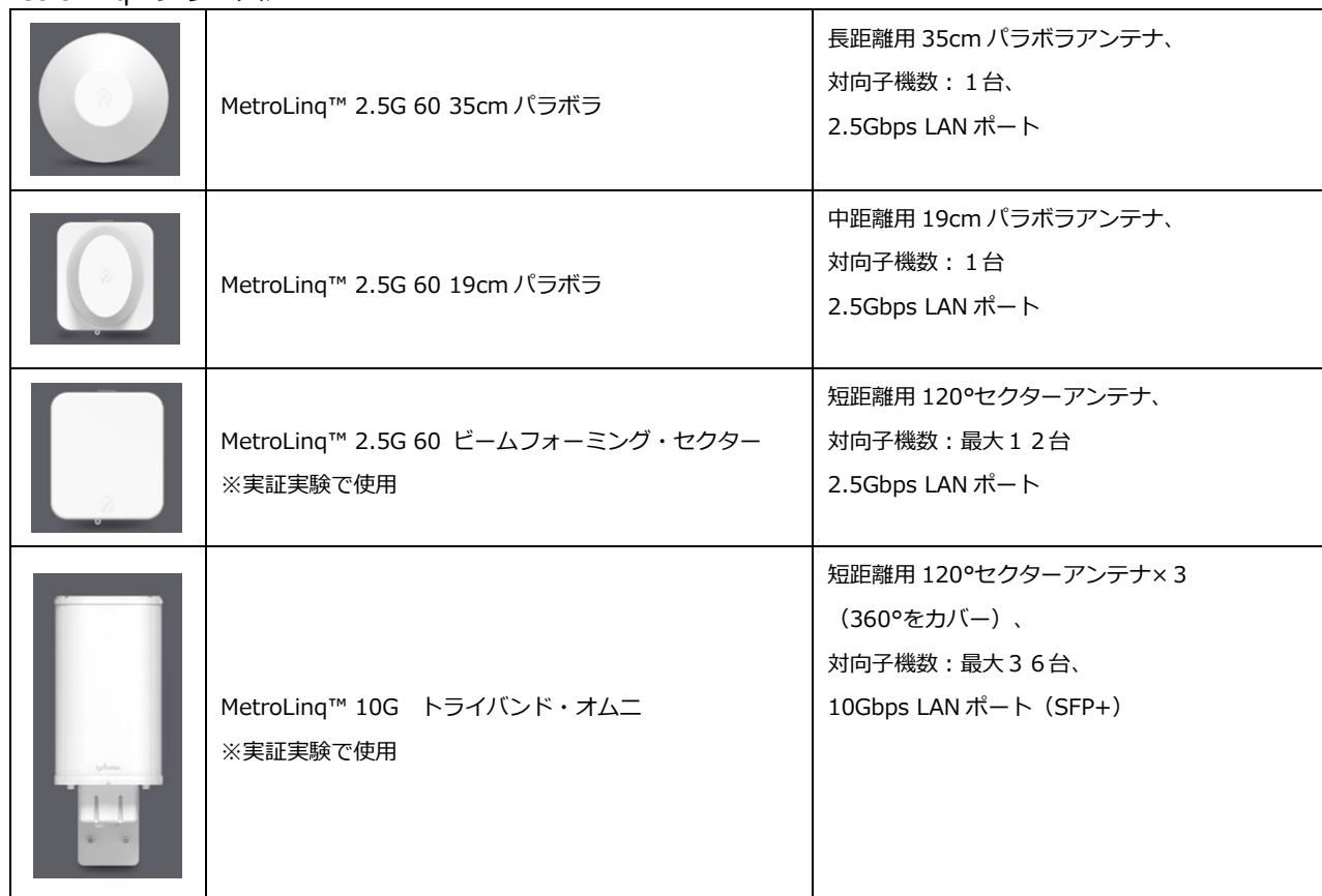
表1 MetroLinq™シリーズ機器一覧

60GHz帯と大口径パラボラアンテナを利用することで、アンテナ間が1Kmの距離においても1Gbps以上の伝送速度を実現します（図2）。