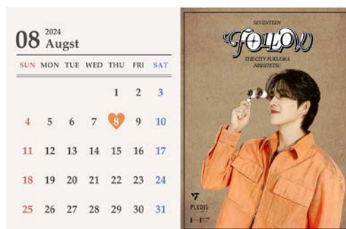
ポストカードイメージ