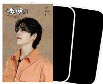
ステッカーイメージ