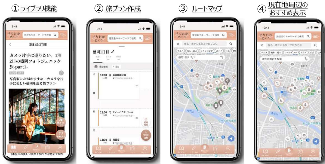
サービスの画像（イメージ）