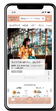
ご提示頂くホーム画面